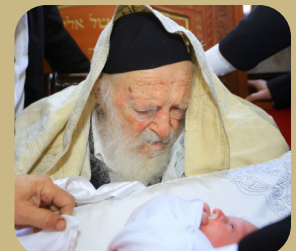
מזן שר התורה הגדולה שלישי"א בסנדקאות בברית

P.S.-Attention Mohalim- If you would like to be involved in this project please get in touch!